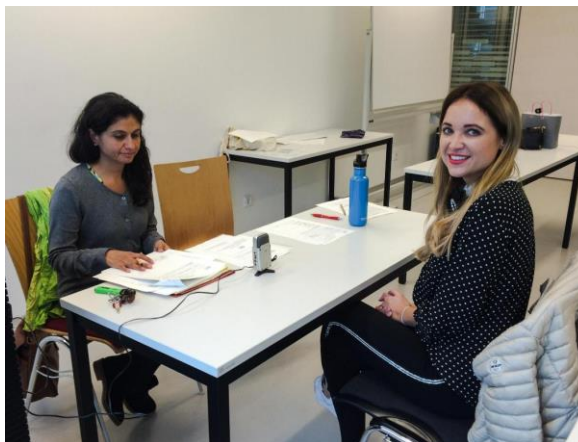
Izquierda: Candidatos del CELU 218 en la Universidad Nacional de Catamarca (UNCA)