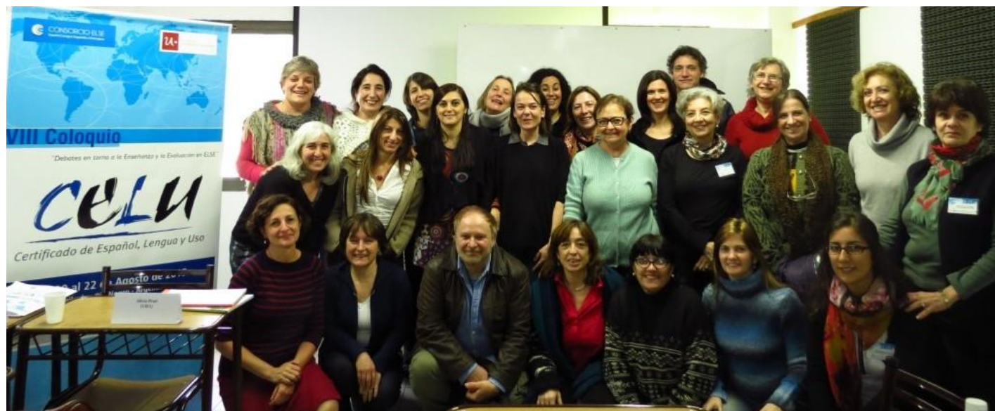
Foto: Participantes del VIII Coloquio CELU.