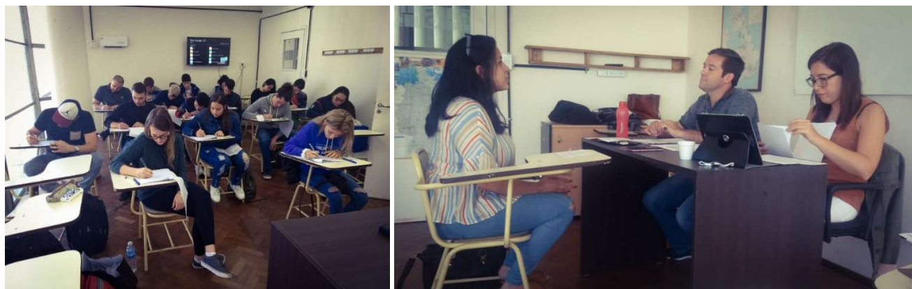
Izquierda: Candidatos del EMDP19 en la Universidad Nacional de Mar del Plata (UNMdP).

> Ver galería completa de imágenes del EMDP19